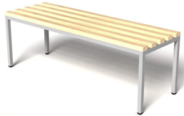
Ławka do szatni 140 cm, kod: TML140 - Rabco - 2szt. - lub równoważna