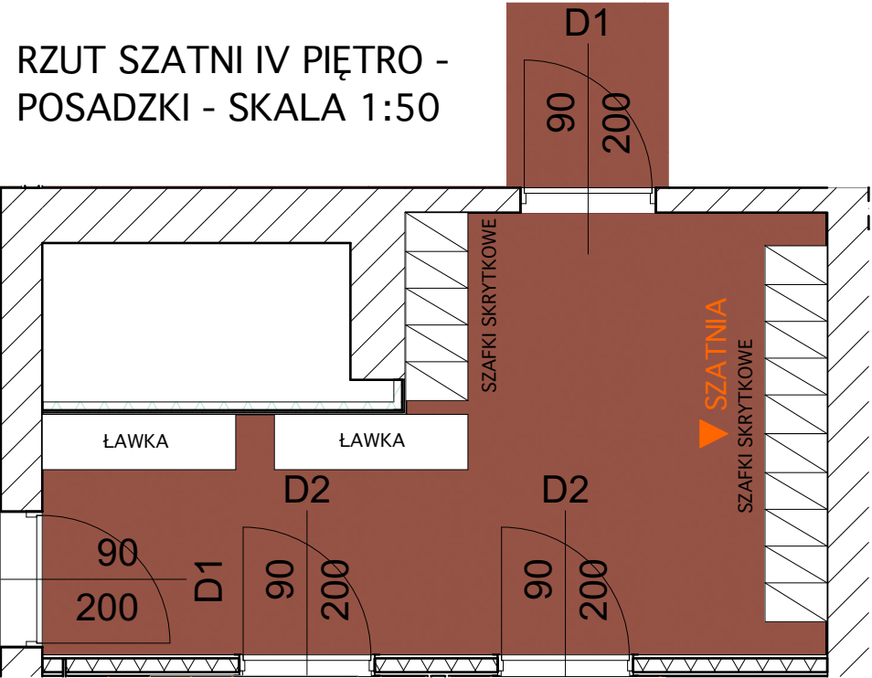
RZUT SZATNI IV PIĘTRO - POSADZKI - SKALA 1:50