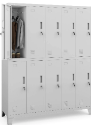
Szafa socjalna ubraniowa 10-drzwiowa BARTEK, 1360 x 1720 x 450 mm, szara - 3szt. - lub równoważna

UWAGI: 1. Wszystkie wymiary sprawdzić na budowie; 2. Oświetlenie wg. rysunków elektryki;